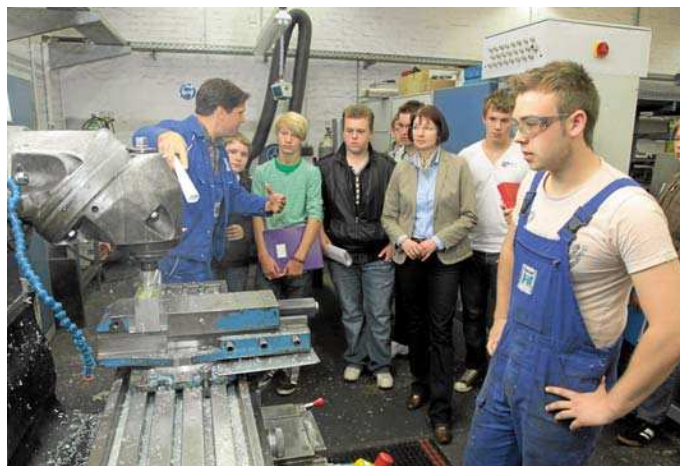
Schule und Betrieb: Einen spannenden Einblick in die Ausbildungsberufe bekamen die Schüler in den Werkshallen von Borgers.