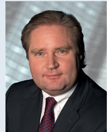
Lutz Lienenkämper, Minister für Bauen und Verkehr des Landes NRW

Donnerstag 29. Oktober 2009 17.00 bis 19.00 Uhr